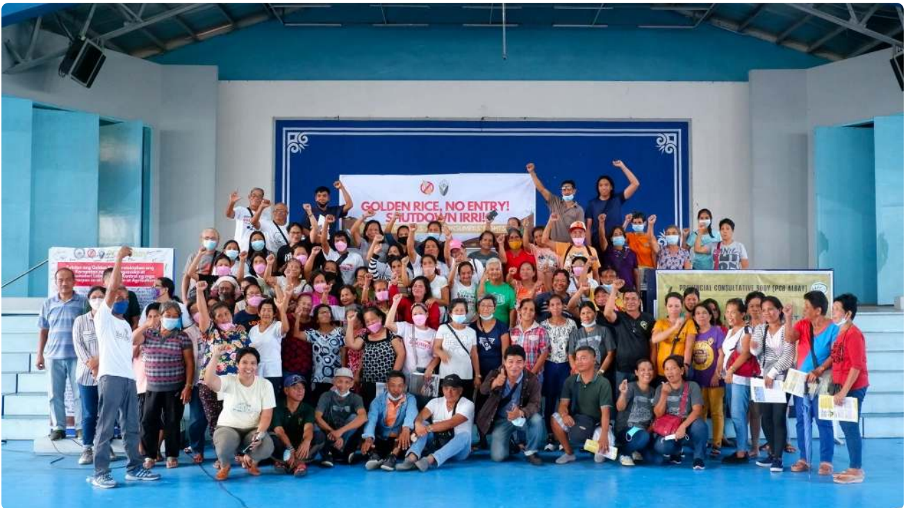
Stop Golden Rice! Netværk (SGRN)